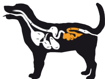
Figur 2: Virkningsområder ved brug af anthelmintikum uden effekt på L3- og L4-stadielarver af T. canis .

Ved at bruge et anthelmintikum som effektivt dræber L3- og L4-stadierlarverne af T. canis , opnår man en grundigere behandling af hunden sammenlignet med midler uden effekt på disse migrerende larver.