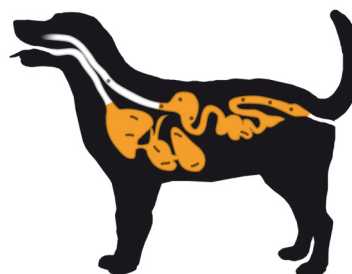
Figur 3: Virkningsområder ved brug af Profender Tabletter.